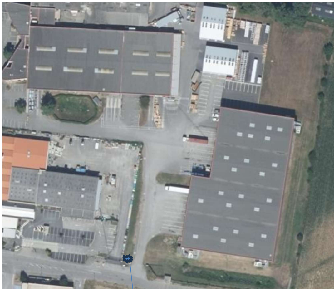
POINT DE RASSEMBLEMENT DAGNEUX 1 ET OPTION DAGNEUX 2